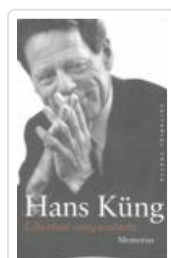
LIBERTAD CONQUISTADA. MEMORIAS HANS KUNG KUNG, HANS