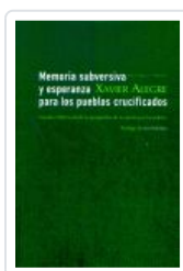
MEMORIA SUBERSIVA Y ESPERANZA PARA LOS PUEBLOS CRUCIFICADOS ALEGRE, XAVIER